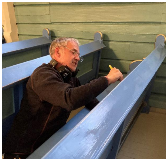
Maling av benkene.