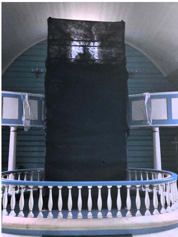
Tildekket alteroppsats ved restaureringen.