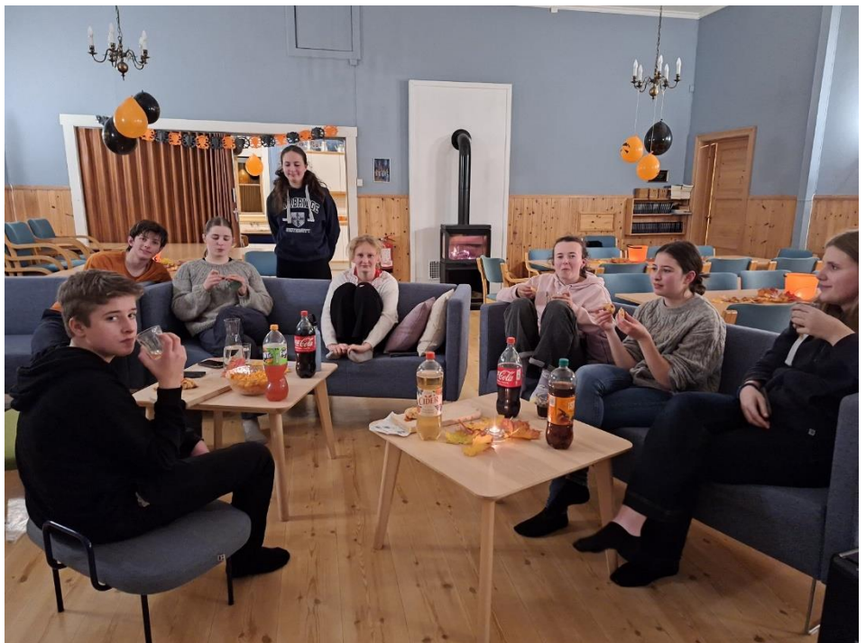
SMUK har Halloweenfest.