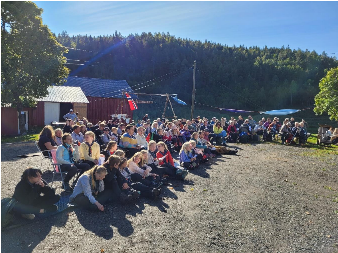
Bilde fra Speidernes natursti på Barland gård.