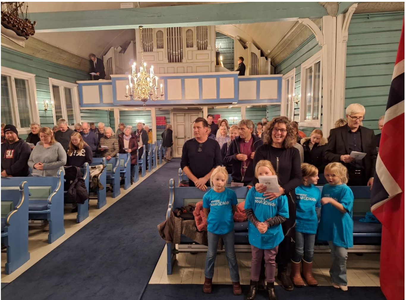
Sang- og musikk gudstjeneste ved bispevisitasen.