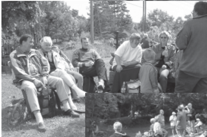
Været var upå- klagelig