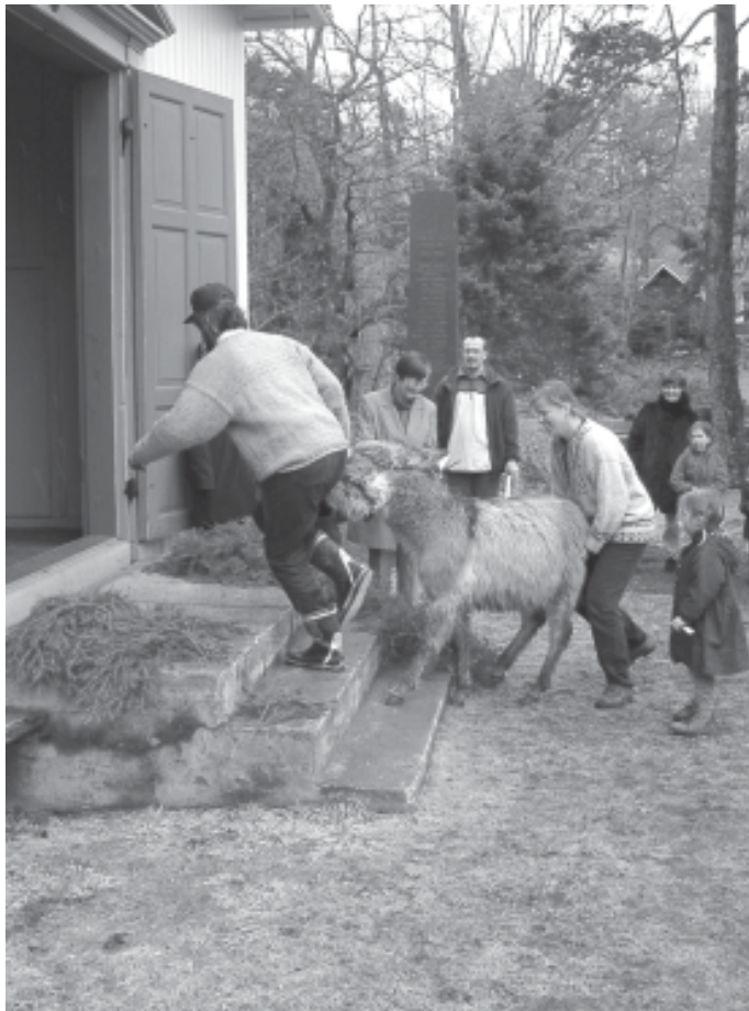
Gjenstridig kirkegjenger i Skåtøy kirke. Se side 10-11.