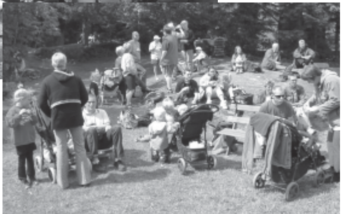
Det blei mangan hyggelig prat med mange hyggelige venner. De sprekeste gikk tur til Skollurheia