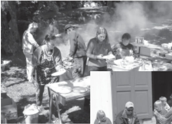
Skåtøy menighetsråd disket opp med grillmat