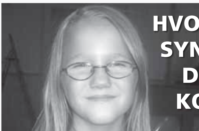
Juni: Er her fordi jeg har lyst, det er morsomt!