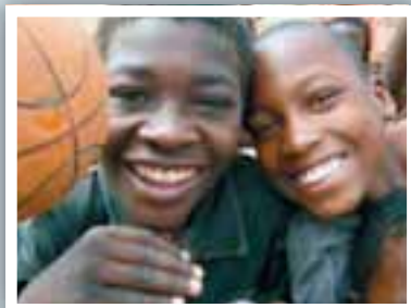
Barn skal slippe å kjempe alene!

De voksne dør, eller klarer ikke å forsørge familien. Støtteapparat finnes ikke. Millioner av barn lever uten tilsyn av voksne og må klare seg alene.