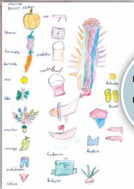
Her er bilde og tegninger fra barn på døveskolen i Morondawa, Madagaskar, som er Kragerø menighets misjonsprosjekt.