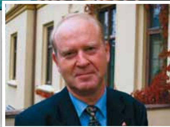
Olav Skjevesland, Biskop i Agder og Telemark

Formålet er å gi hjelp til barn som er rammet av hiv/aids. Det er dramatiske tall som her møter oss: Hver dag mister 6000 barn foreldrene sine av hiv/aids og 1400 barn dør daglig av samme sykdom. Aids har gjort 15 millioner barn foreldreløse. Bak slike tall ligger et hav av sorg og savn og lidelse. Det er vår plikt