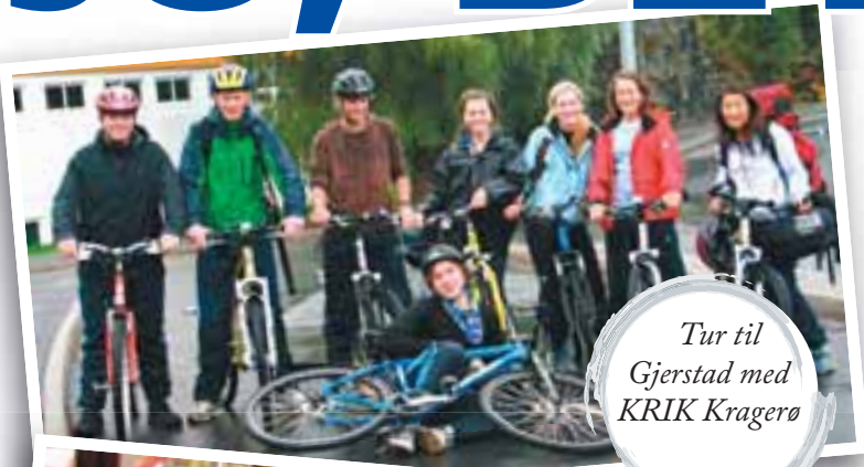
Tur til Gjerstad med KRIK Kragero