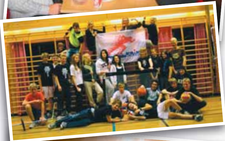
Explore, KRIKs nyttårsfeiring i Lillehammer