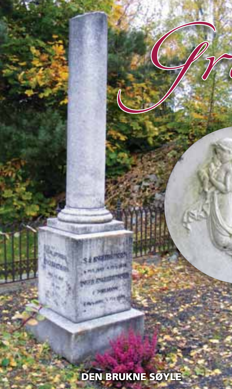
DEN BRUKNE SØYLE

å kirkegårdene våre er det mange ulike gravminner, fra forskjellige tids-epoker. Tidligere var det ikke uvanlig å sette opp store, monumentale gravminner. De er jo svært uheldige, så i senere tid er gravminnets størrelse regulert i "Forskrift til lov om kirkegårder, kremasjon og gravferd." Størrelsen er knyttet opp mot både tyngde og fasong, og er litt ulik i forhold til størrelsen på graven. På nyanlagte deler av kirkegårdene er gravene noe større enn på de gamle delene av kirkegårdene. Det er kirkelig fellesråd som skal godkjenne gravminnene før de kan settes opp på kirkegårdene.