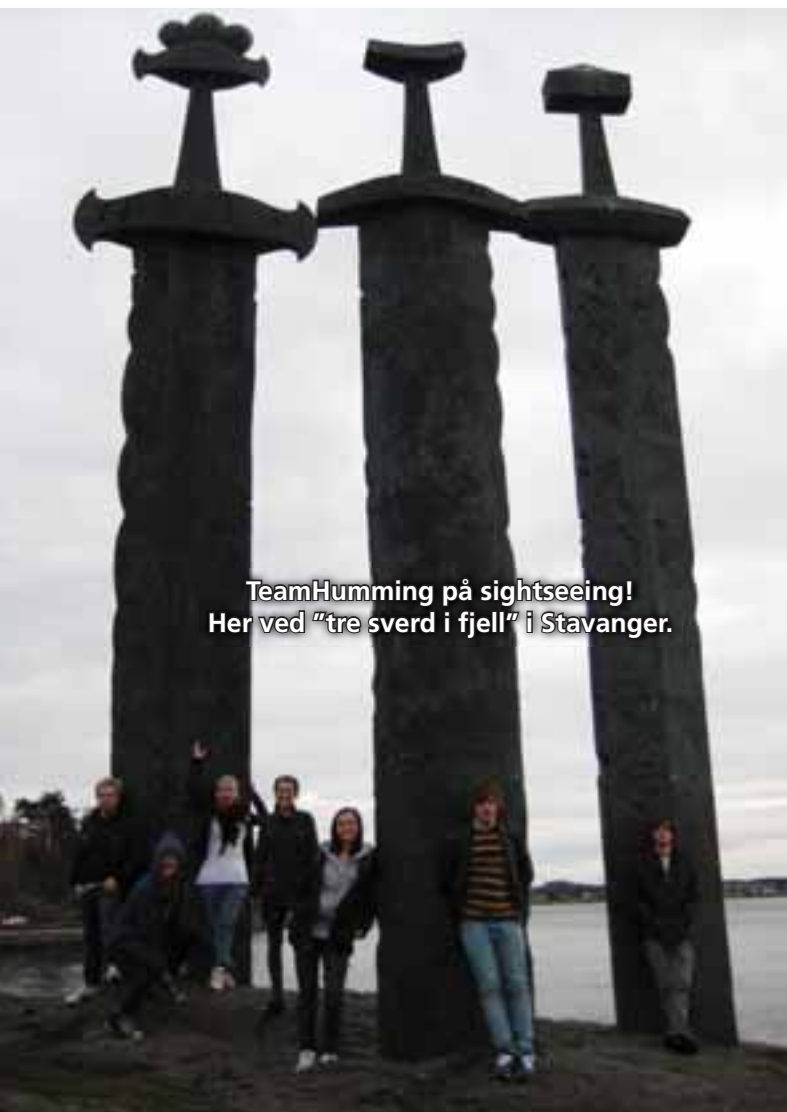
TeamHumming på sightseeing! Her ved "tre sverd i fjell" i Stavanger.