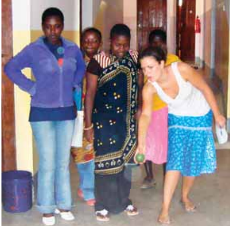
Jeg lærer jentene å spille bowling med pasjonsfrukt på naturstien vi arrangerte.

I tillegg til dette fikk vi opplevd livet på landsbygda. Alt vannet som ble brukt var regnvann, så for hver klesvask måtte vi hente vann i brønnen. Også en ny opplevelse å vaske ansiktet i vann fullt av fluer og andre insekter. Elektrisitet var det kanskje mellom kl 19.00 og 23.00, så da var det kø rundt stikk-kon-