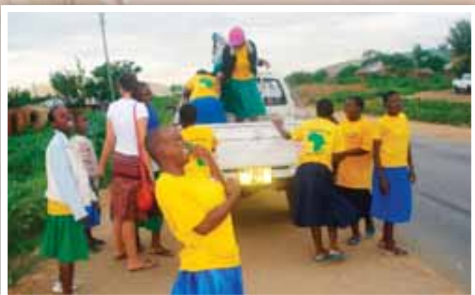
Her står vi med jentene og venter på nye frivillige som kommer med bussen.