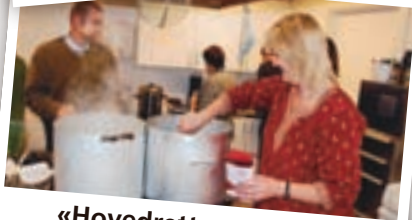
«Hovedrett - gruppen»