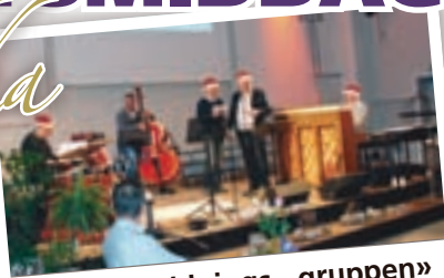
«Underholdnings - gruppen»