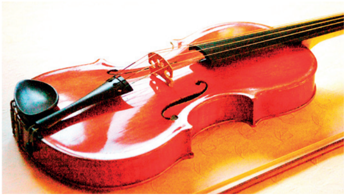
Fiolin nr. 2. 2014.

som skal felles ned ved kanten av lokket og i bunnen - det krever både nøyaktighet, tålmodighet og spesialverktøy».