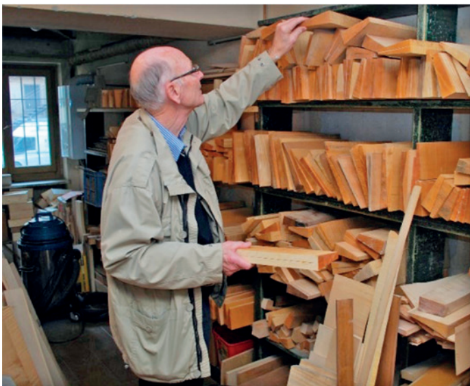
I Cremona 2012.