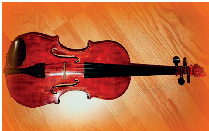
Min Guarneri nr. 1 1992. Modell 1734.