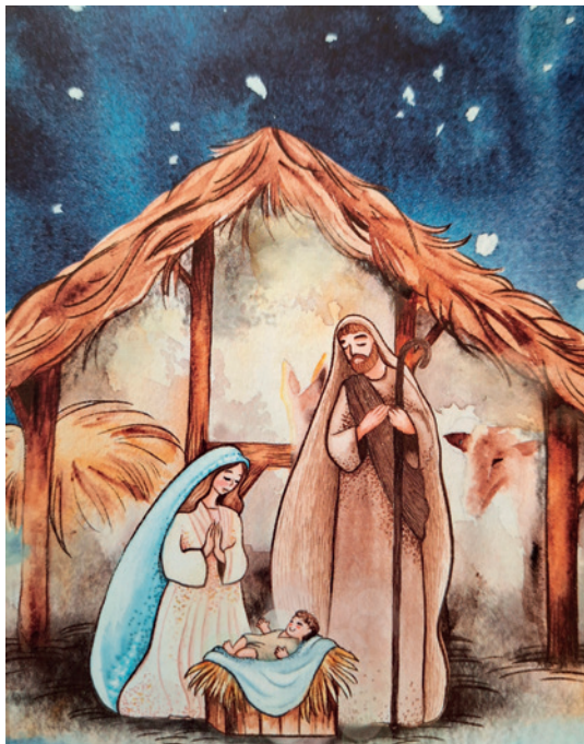
Julekort fra Sjømannskirken

men det var han ikke. Maria er også av Davids slekt, og når engelen besøkte henne og når Den Hellige Ånd kom over henne var hun jomfru. Hun er den som bar frem Menneskesønnen, Faderen til barnet var Gud selv, barnet var løven av Juda, han som eier septret og herskerstaven.