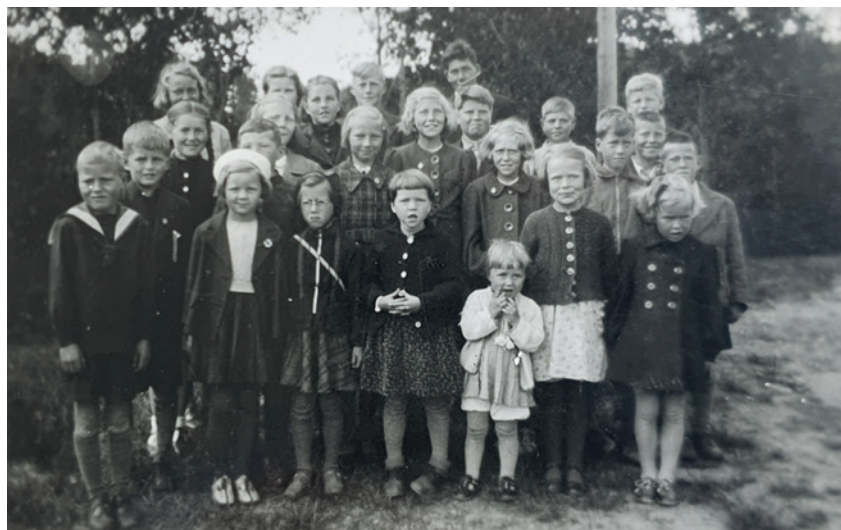
Søndagsskolebarn på 1940-tallet.