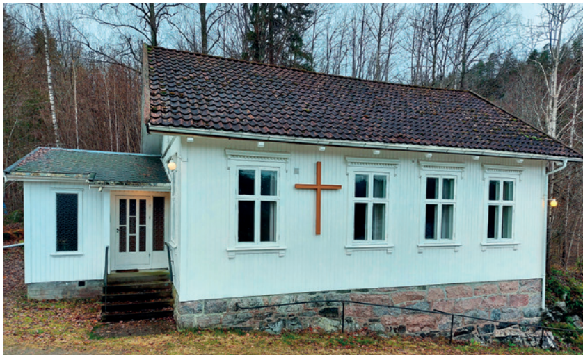
Kammerfoss bedehus senhøsten 2022.