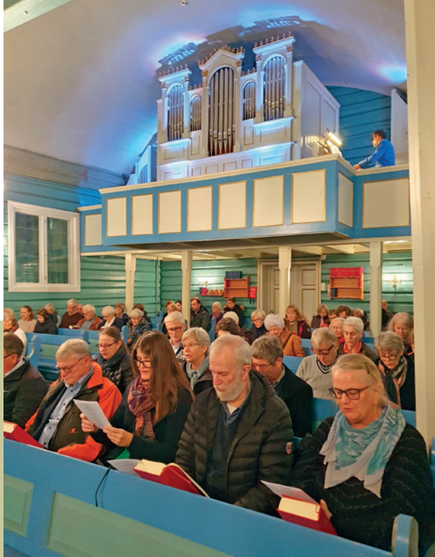
Første salme synges til det nye orgelet.