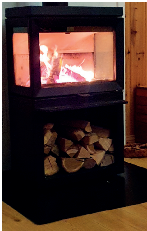
Ovnen på Mo bedehus.

Og noen ganger må noen betale litt for å komme sammen her, både i glede og i sorg (for det er jo noen som må betale for at jeg skal holdes i orden og at det er godt og varmt her inne). Men jeg er ihvertfall glad de samles her også. Både kirka og jeg vil jo gjerne stå her for dere alle!